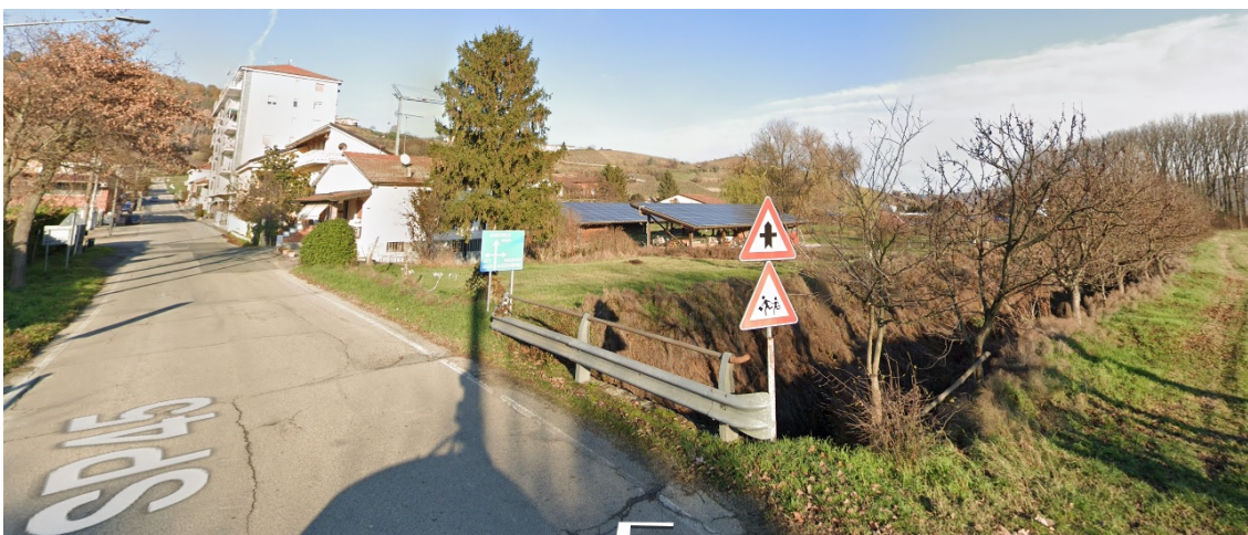
Immagini Google - Street View