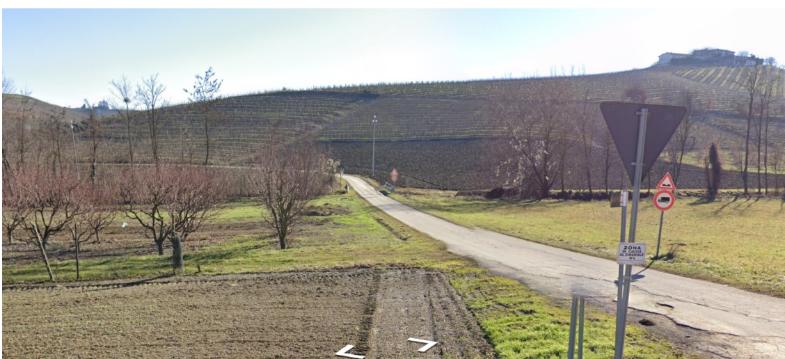
Immagine Google - Street View